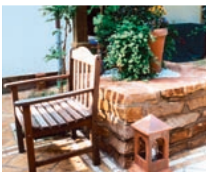
↑ Osnabrück Hausgarten Rachut An der Ludwigshalle 1, 49086 Osnabrück, Bauherrin: Gunda Rachut, Landschaftsarchitekten: Silke Emmrich, Hans Wilding (Bramsche-Malgarten)